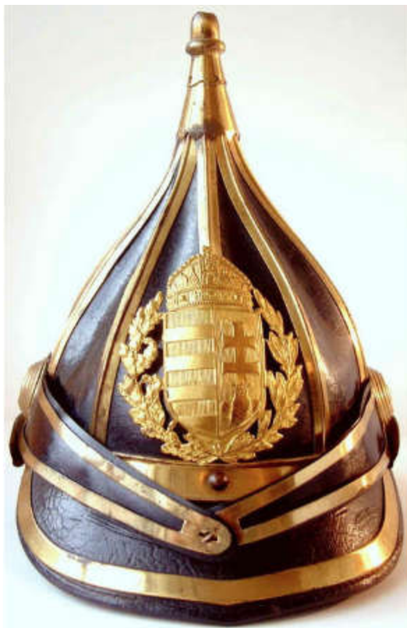
(A legénységénél a fém alakrészek ezüst színben.)