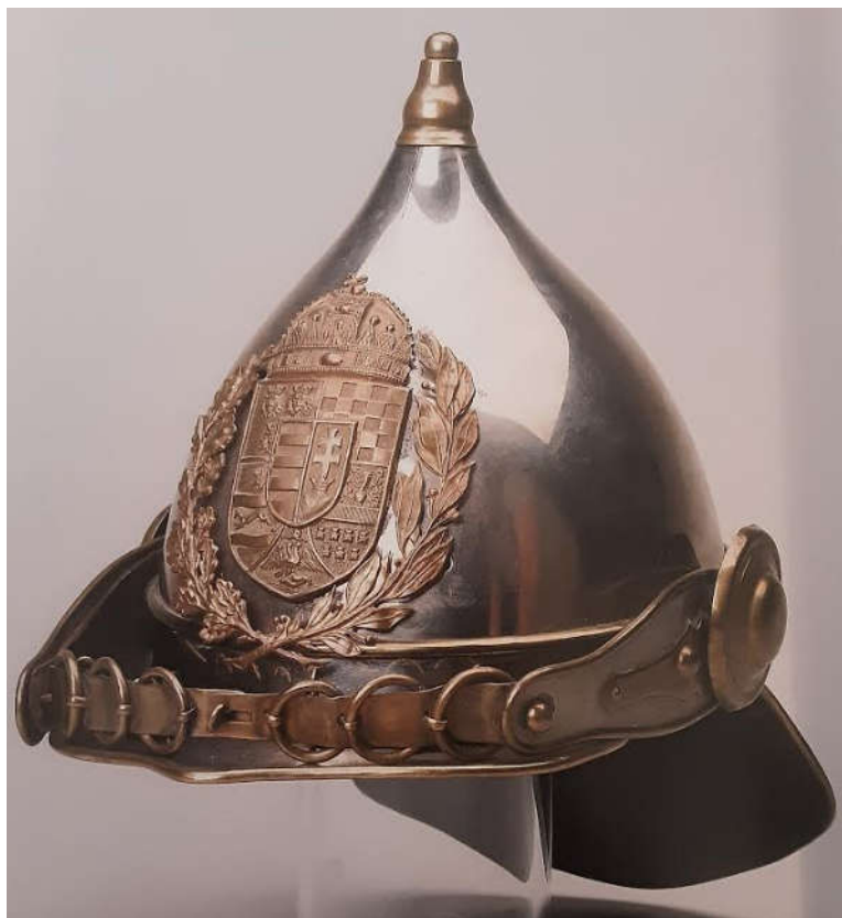
(Azonos az 1872 mintájú koronaőr sisakkal.)